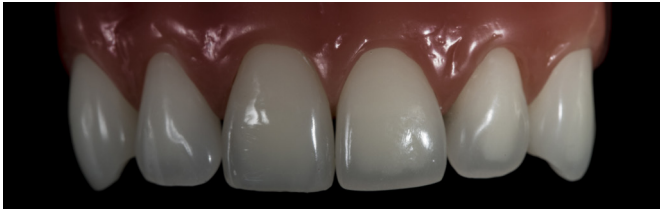
Materiały z warsztatu praktycznego: estetyczna odbudowa ubytku IV klasy

Optymalne rozwiązania w stomatologii estetycznej.